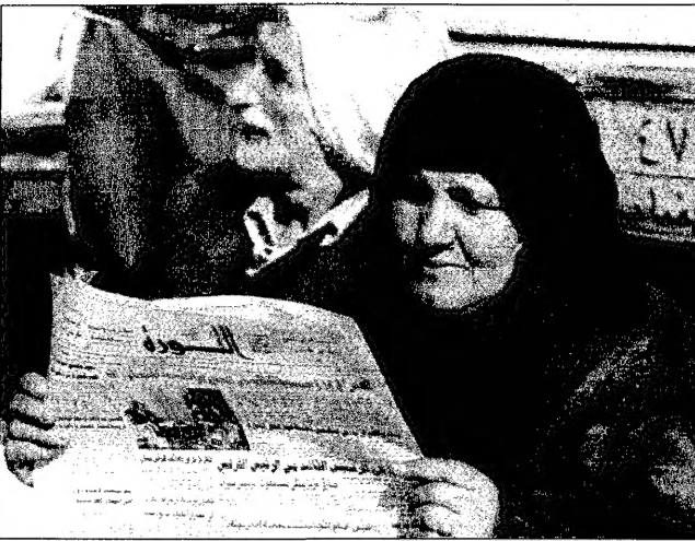
سياسة عراقية تتابع التطورات في السمعة

نزار حمون: بغداد على ضرب اسرائيل ■ بيروت - قال نزار حمون امس ان بغداد على ضرب اسرائيل. وقال نزار حمون في بيان له امس انه لن يتصرف ب «واقحة» وسنعارض اي ضربة للعراق. وقال نزار حمون في بيان له امس انه لن يتصرف ب «واقحة» وسنعارض اي ضربة للعراق.